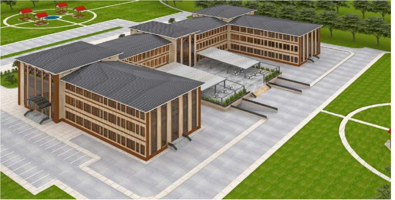
*Tıp Fakültesi Morfoloji Binası Projesi