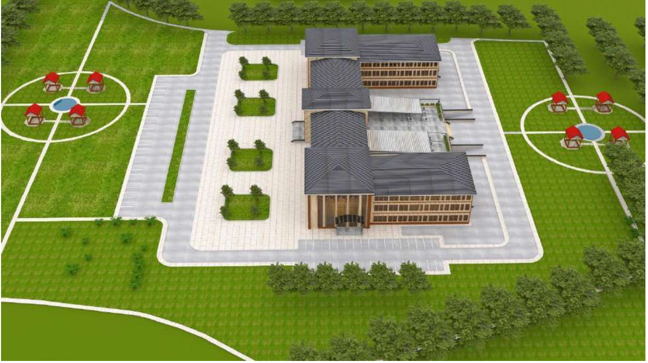
*Tıp Fakültesi Morfoloji Binası Projesi